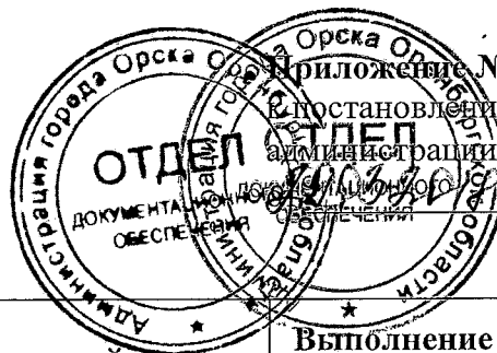
Таблица № 1