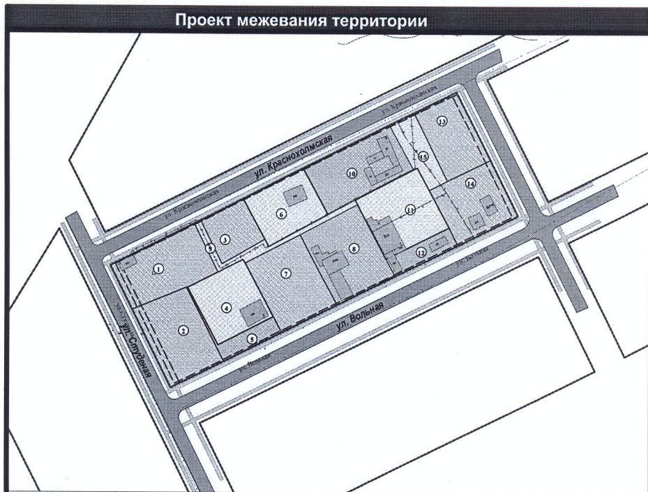
Экспликация земельных участков