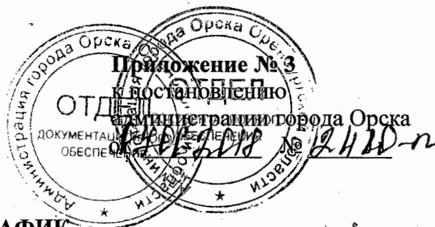
ГРАФИК приема муниципальных образовательных организаций к 2018-2019 учебному году