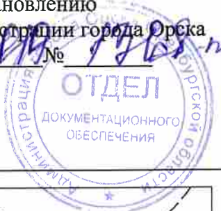
СХЕМА границ проектирования территории

администрации города Орска от 12.03.2019 № 7/2019-н